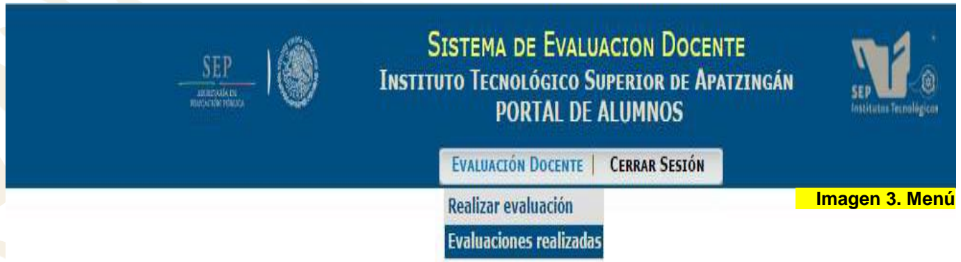
Imagen 3. Menú