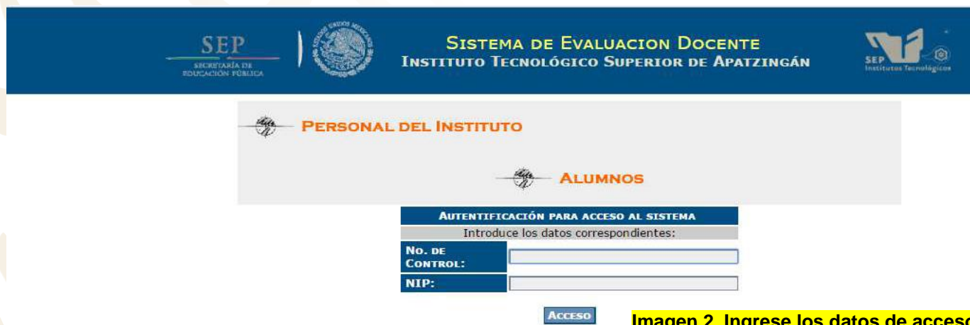
Imagen 2. Ingrese los datos de acceso